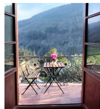
Arriba, D. Krpan en su taller. Abajo, balcón de la Casa del Agua donde tomar un café o leer.

hidráulicos y los usos del agua a través del tiempo hay nuevos paneles, nuevos contenidos y una oferta de actividades educativas pensadas en especial para los más pequeños. ¡Os esperamos!