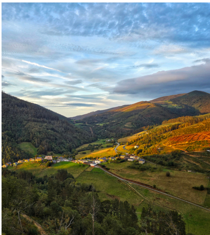
Bres, Taramundi.

La Casa del Agua, por su parte, ha recuperado la memoria de la antigua escuela indiana.